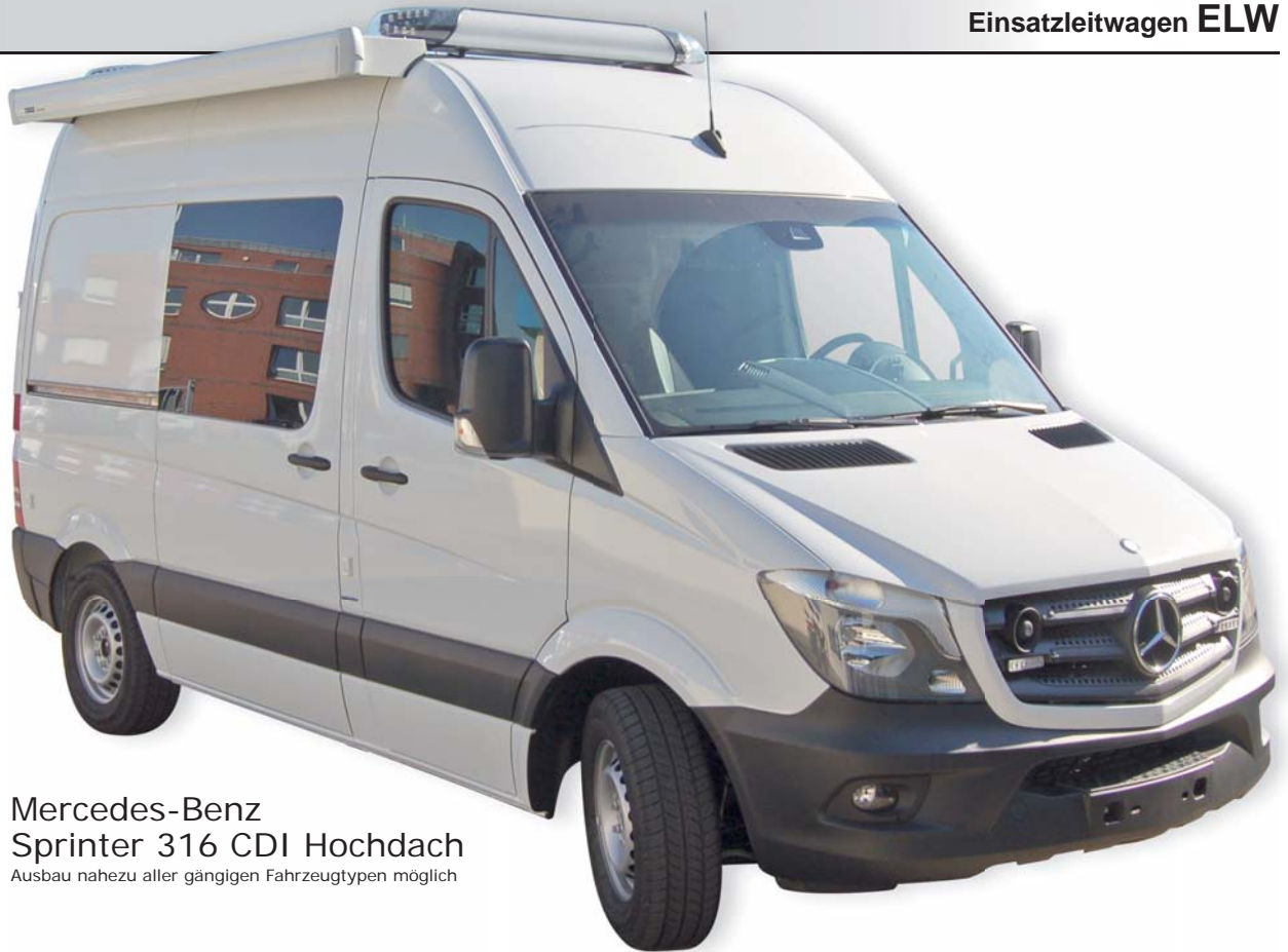
Mercedes-Benz Sprinter 316 CDI Hochdach Ausbau nahezu aller gängigen Fahrzeugtypen möglich

IuK-Technik • Sondersignalanlage • Elektrotechnische Ausstattung Innenausbau Besprechungsraum • Innenausbau Laderaum • Markise