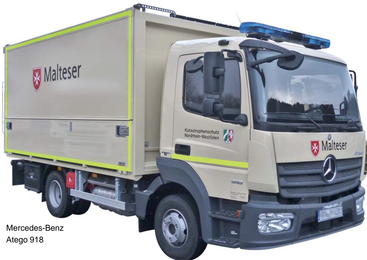
Mercedes-Benz Atego 918