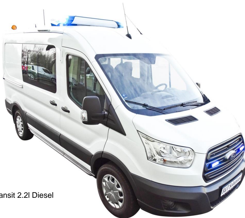
Ford Transit 2.2l Diesel